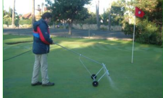
Komposttee wird besonders gern auf Golfplätzen eingesetzt, da er die Verwurzelung in sandigen Böden verbessert.