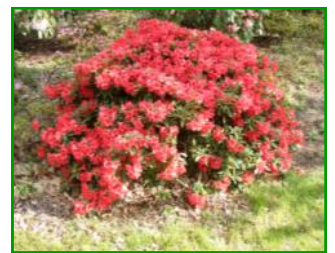
Die Pflanzen sehen besser aus denn je