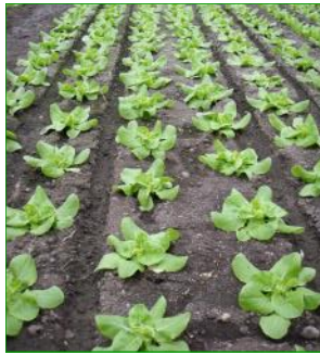
Kommerziell in Treibhäusern in der Schweiz angebauter Salat und im Zelt angebaute Tomaten in Südafrika