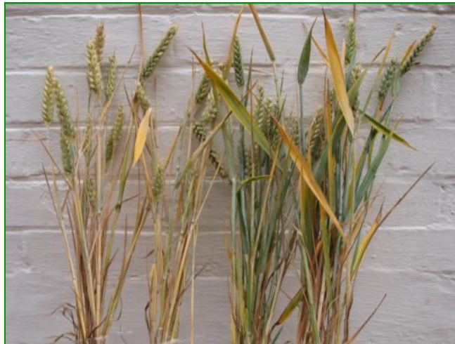
Weizenprobe aus mit Komposttee behandeltem Bestand