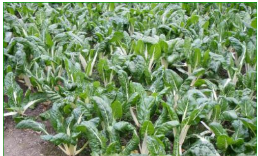
Im Gewächshaus angebauter Mangold, dessen Setzlinge zuvor in Komposttee getaucht wurden.