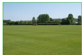
Komposttee-Versuchsfläche an der Oakham School