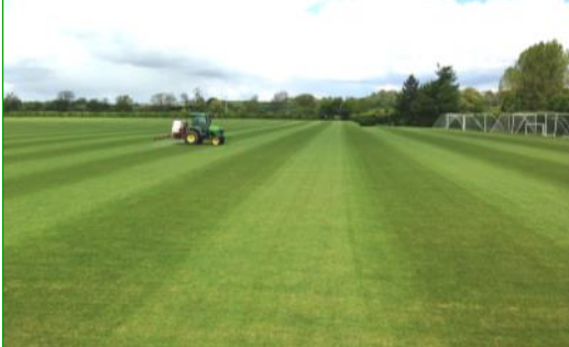
Die bekanntesten Sportplätze der Oakham School haben von regelmäßigen Komposttee-Anwendungen profitiert.

Anwender von Komposttee konnten den Fungizideinsatz auf Sportrasen um bis zu 100% senken und stellen ein verringertes Auftreten von Erkrankungen fest. Die nützlichen Mikroorganismen und Mikronährstoffe im Komposttee unterstützen auch die Eindämmung von Unkraut, verbessern die Wurzelbildung, ohne das Halmwachstum zu fördern und senken die Erhaltungskosten von belasteten Sportrasenflächen.