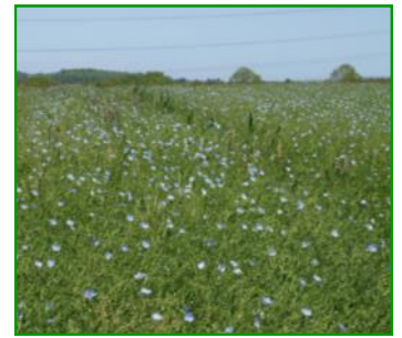
Landwirtschaftlicher Versuchsstandort mit Weizen, Raps und Leinsamen