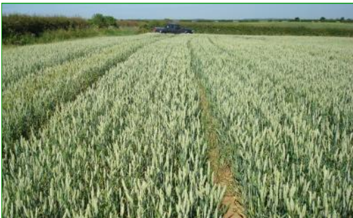
Weizenversuchsfläche mit 25% Ertragssteigerung, höherem spezifischen Gewicht und höherem Proteingehalt.

Bei der großflächigen Erzeugung von Feldfrüchten steigt die Bedeutung von Komposttee, da damit der Einsatz von Dünger und agrochemischen Produkten wegen steigender Kosten gesenkt werden kann. Die Ergebnisse der Versuche mit Weizen und Raps in Großbritannien und der Verwendung von Komposttee bei Tomaten in Südafrika finden Sie weiter hinten in diesem Prospekt.